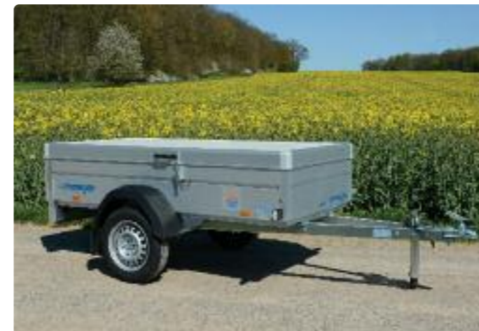
HZ 7521/106 Zubehör: Stützrad, Sandwichludeckel HZ 7521/106 Options : roue jockey, hardtop en aluminium sandwich HZ 7521/106 Optional extras: jockey wheel, sandwich aluminium hardtop