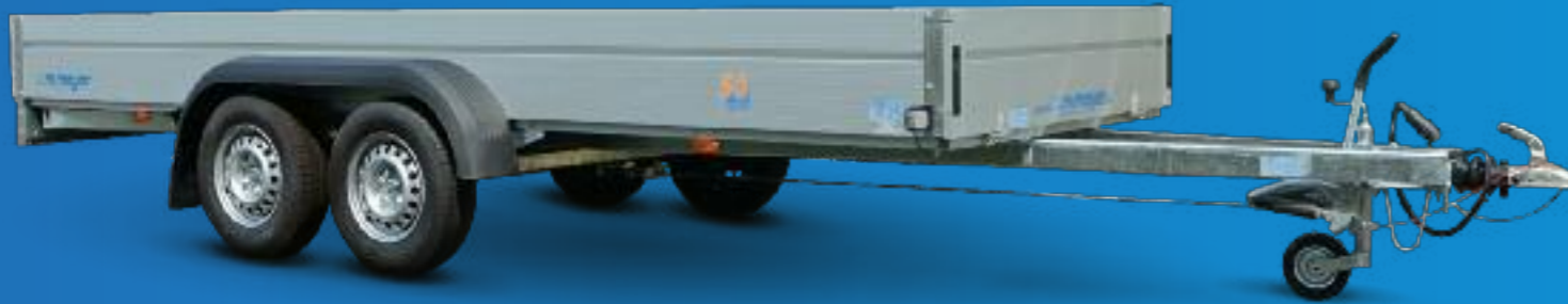
BT 2045/155 Zubehör: Stirnwand klappbar • BT 2045/155 Option : ridelle avant ouvrable • BT 2045/155 Optional extra: front panel which can be opened

Wir haben für jeden den passenden Anhänger!