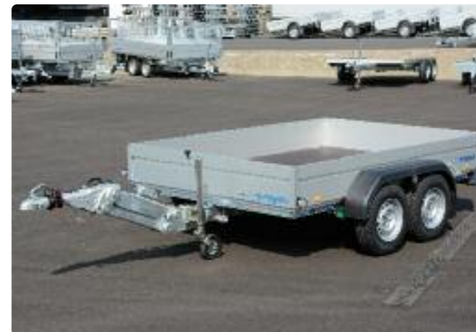
BT 3030/200 Zubehör: 100 km/h, Deichsel höhenverstellbar BT 3030/200 Options: Kit « rouler plus confortablement », timon réglable BT 3030/200 Optional extras: smooth-ride kit, adjustable drawbar