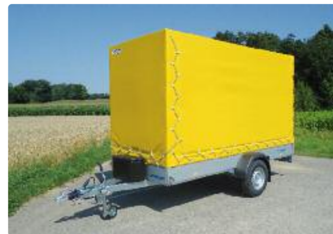
B 1335/151 Zubehör: Staubox, Plane und Spriegel B 1335/151 Option : box, bâche et ossature en aluminium B 1335/151 Optional extra: canvas top and aluminium support