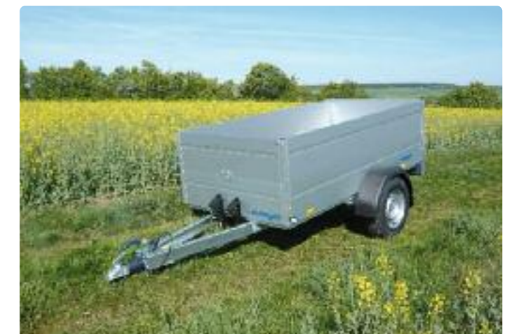
HZB 1225/126 Zubehör: Alubordwanderhöhung (Höhe: ca. 350 mm) HZB 1225/126 Option : ridelles supplémentaires en alu (haut.: 350 mm env.) HZB 1225/126 Opt.: additional aluminium side panels (h.: approx. 350 mm)