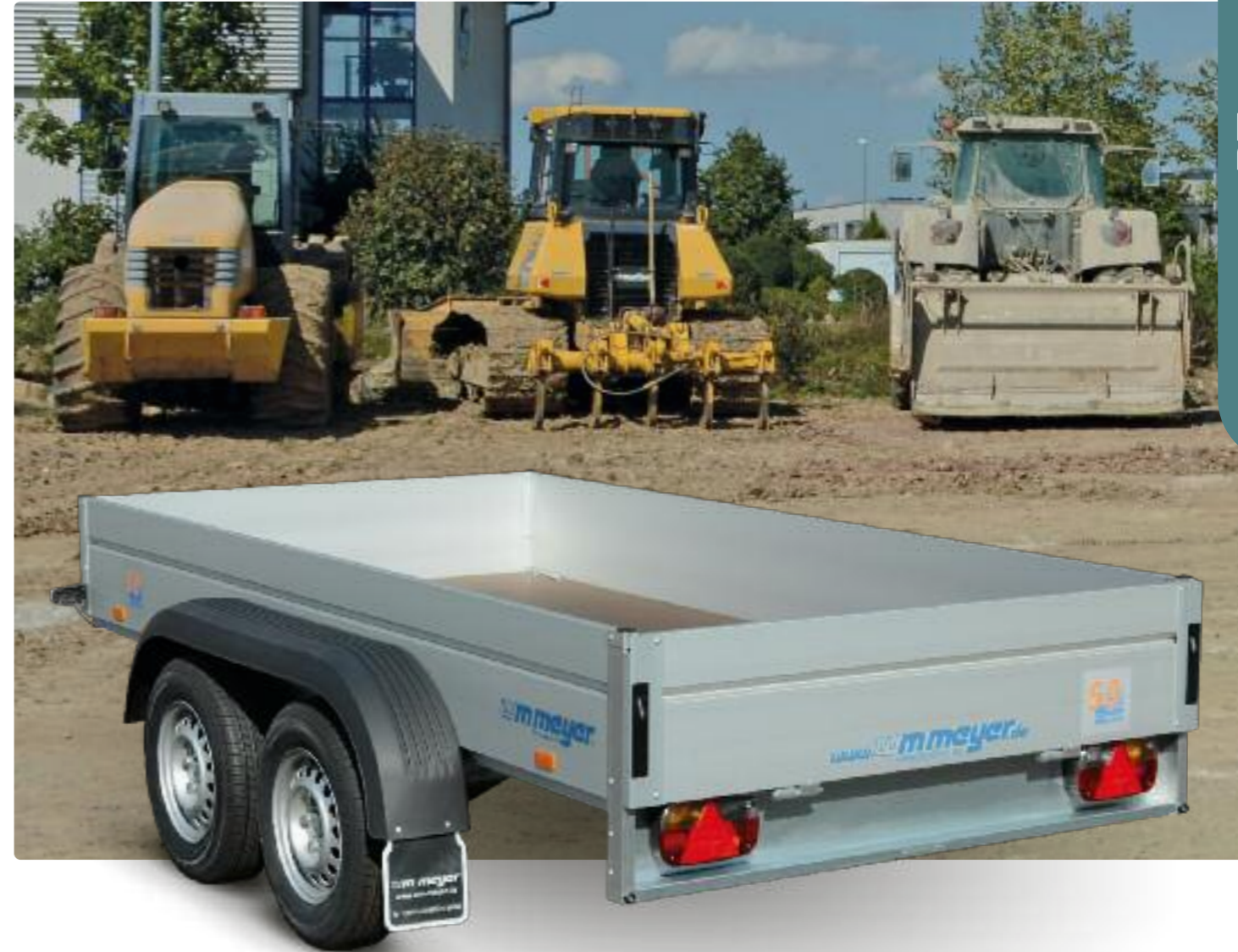
BT 2030/151 V-Deichsel, Stützrad, Aluminiumbordwände eloxiert mit Sicke zur Planenbefestigung (Stärke: 25 mm, Höhe: 350 mm) BT 2030/151 Timon en V, roue jockey, ridelles en alu anodisé avec rainure pour attacher une bâche (épaisseur: 25 mm, hauteur: 350 mm) BT 2030/151 V drawbar, jockey wheel, anodised aluminium side panels with seam to fasten canvas top (width: 25 mm, height: 350 mm)