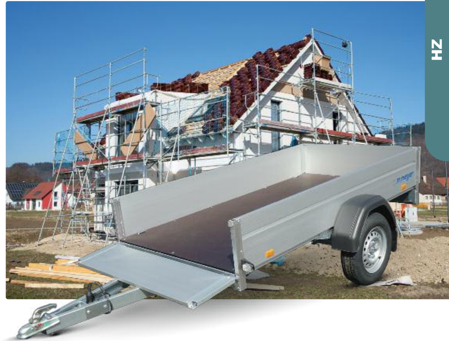
HZ 7575/126 Alubordwände eloxiert mit Sicke zur Planenbefestigung (Stärke: 25 mm, Höhe: 350 mm), Zubehör: Stirnwand klappbar, 4 Zurrbügel HZ 7521/106 Ridelles en alu anodisé, rainure pour attacher une bâche (épaisseur : 25 mm, hauteur : 350 mm), opt. : ridelle av. ouvrable, 4 crochets d'arrimage HZ 7521/106 Anodised aluminium side panels, seam to fasten canvas top (width: 25 mm, height: 350 mm), optional: front panel which can be opened, 4 tie rings