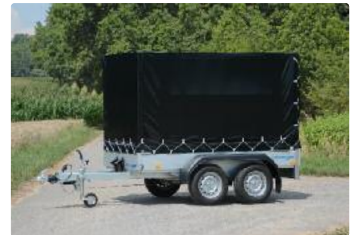
BT 2025/126 Zubehör: Plane und Aluspriegel (Höhe: 1.400 mm) BT 2025/126 Option: bâche et ossature en aluminium (hauteur: 1.400 mm) BT 2025/126 Optional extra: canvas top, aluminium support (height: 1,400 mm)