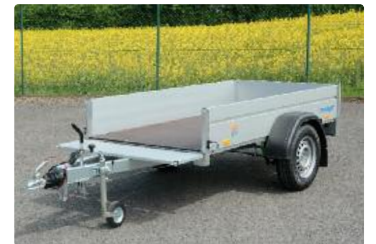
B 1325/126 Zubehör: 100 km/h, Stirnwand klappbar B 1325/126 Options : ridelle avant ouvrable, main-courante en alu B 1325/126 Optional: smooth-ride kit, front panel which can be opened