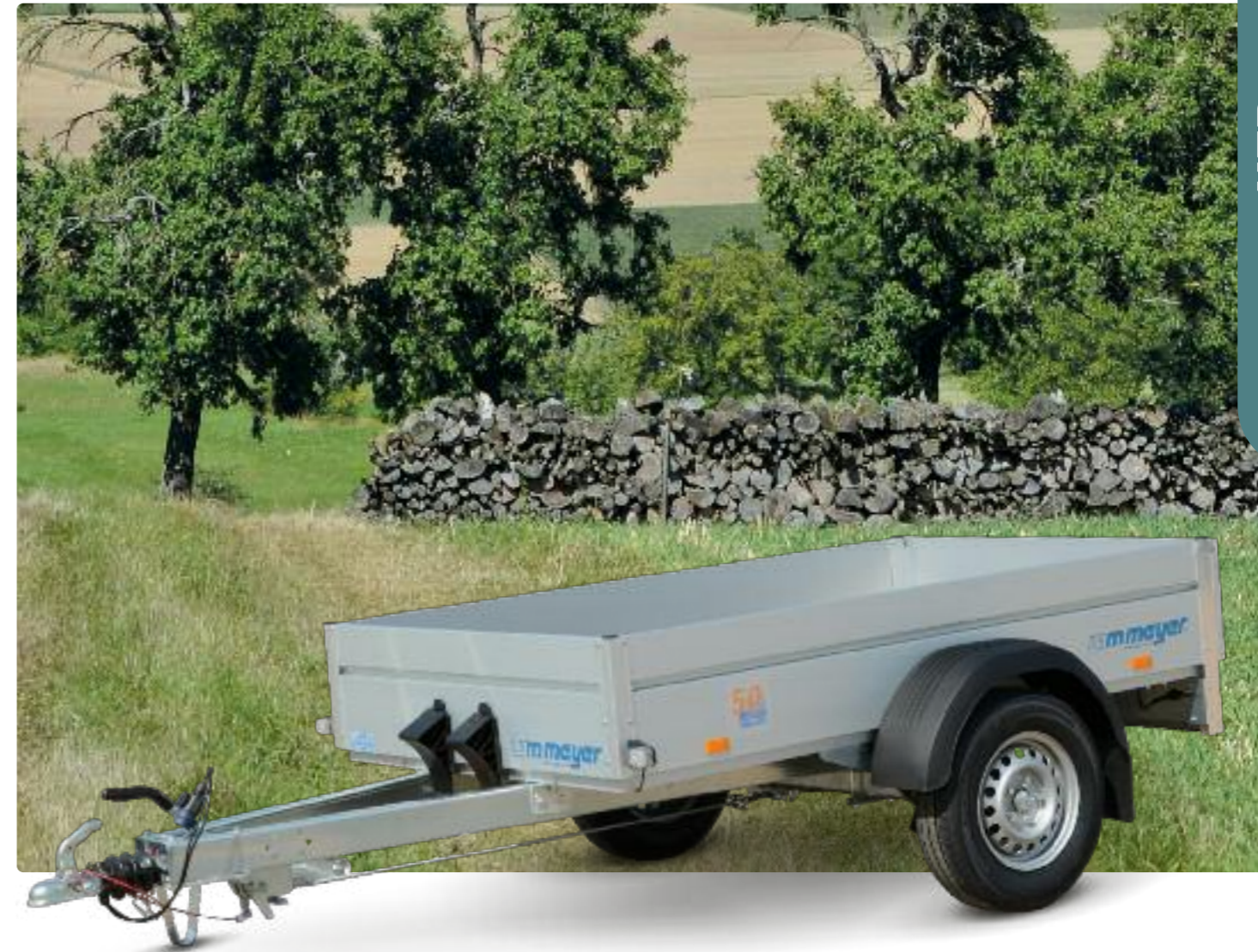
HZB 1021/126 Aluminiumbordwände (Höhe: 350 mm), Kunststoffkotflügel HZB 1021/126 Ridelles en aluminium anodisé (hauteur : 350 mm), garde-boues en plastique HZB 1021/126 Aluminium side panels (height: 350 mm), plastic mudguards