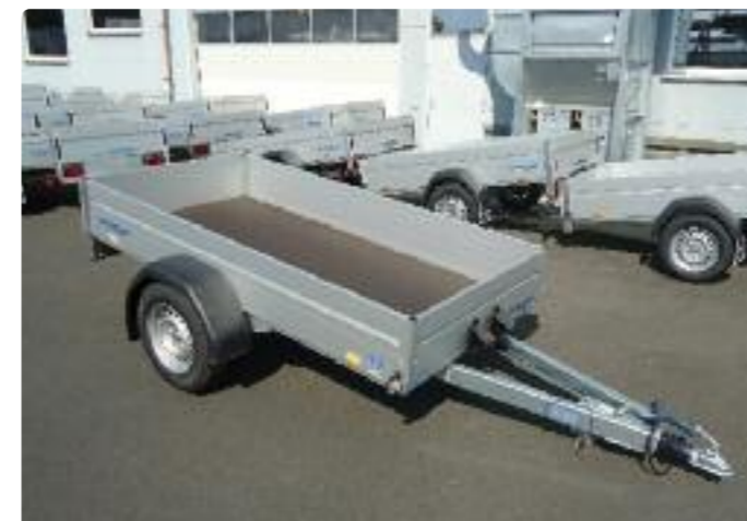
HZB 1025/126 V-Deichsel, Siebdruckholzboden HZB 1025/126 Timon en V, plancher en bois antidérapant imperméabilisé HZB 1025/126 V drawbar, high-density plywood platform