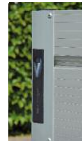
Innenliegender Verschluss: geschlossen und geöffnet Serrure intégrée : fermée et ouverte Fastening integrated into side panel: closed and open